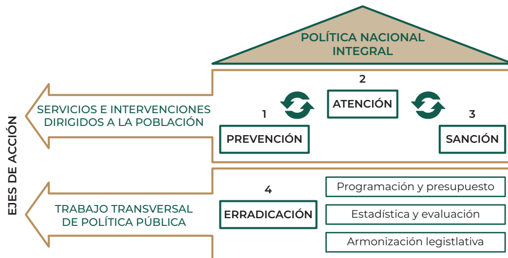
Figura 2. Ejes de la Política Nacional Integral

Llama la atención que la Ley General de Acceso, en sus diversas reformas, ha ido incorporando obligaciones puntuales a ciertas dependencias federales y niveles de gobierno con relación a las modalidades de violencia, como es el caso de la violencia familiar, la institucional, la laboral, la docente y la política dejando en la generalidad al resto, sin embargo, no desarrolla en su totalidad los ámbitos de ocurrencia de las violencias contra las mujeres.